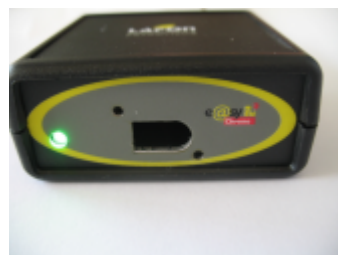
4- Alimentation OK