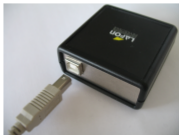
2- Connexion boîtier